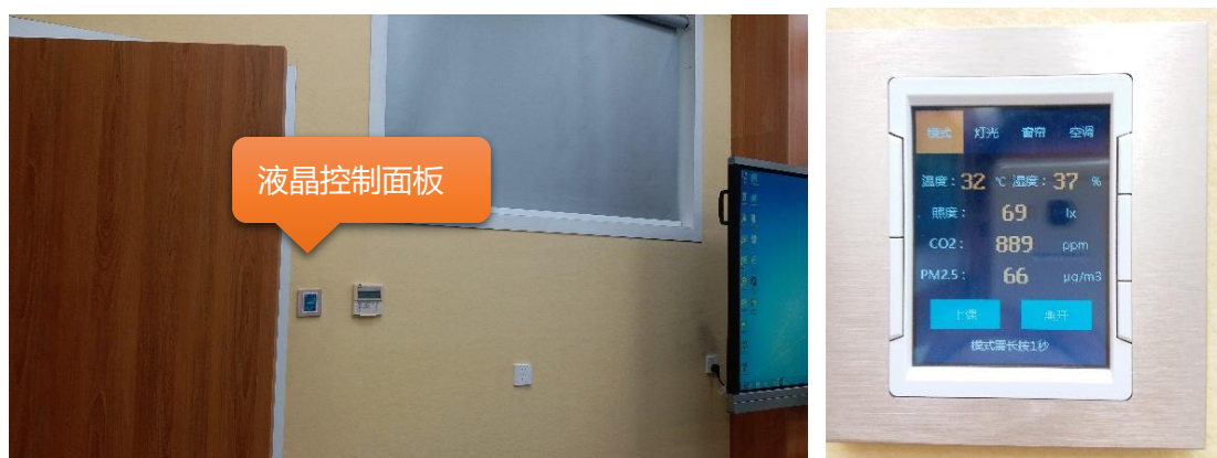
图：一键开启所有教学设备