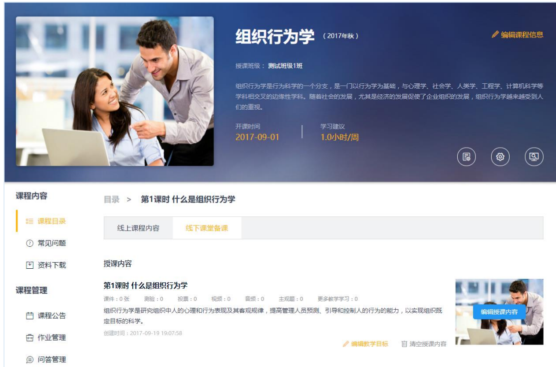
图：构建课程目录、维护授课内容