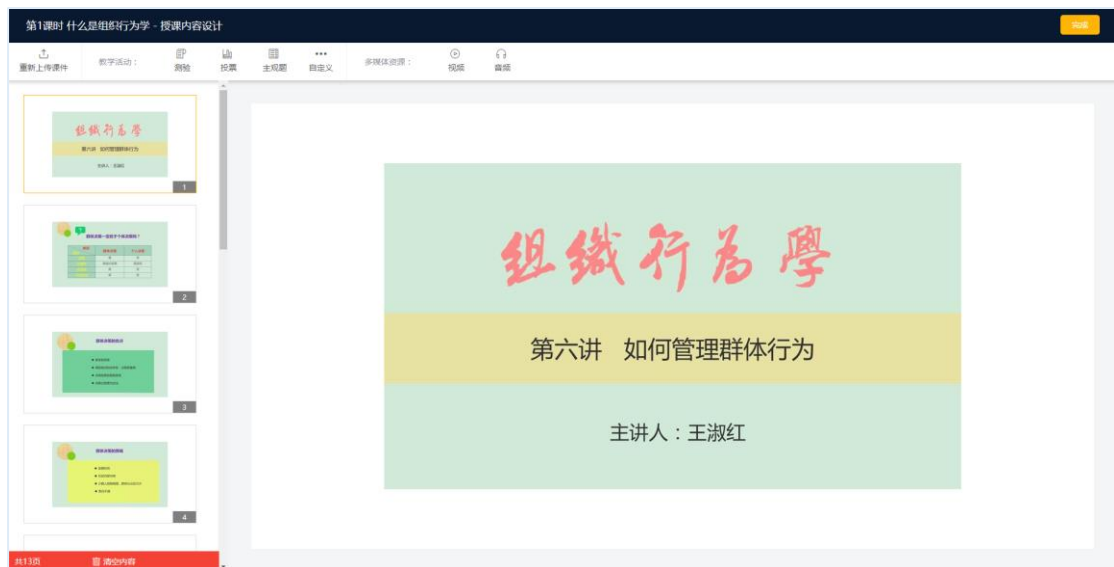
图：上传 PPT，编辑教学活动