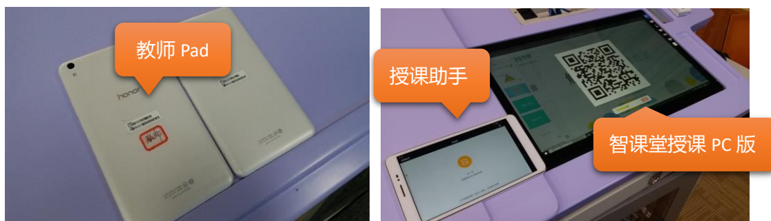
图：教师 Pad 扫码连接课堂，实现移动授课

使用教师 Pad ( 可在充电车中获取，背面有标签标记 )，打开“授课助手”APP 扫描 PC 端二维码连接课件，实现移动授课。